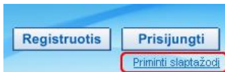
5 pav. Slaptažodžiui priminti skirta nuoroda

Jei pamiršote slaptažodį, nesiregistruokite iš naujo . Atsisiųsti prisijungimo slaptažodį galite į savo el. paštą. Spauskite viršuje dešinėje pusėje esančią nuorodą „ Priminti slaptažodį “ ir atsidariusiame lange įveskite savo el. pašto adresą.