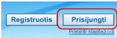
4 pav. Prisijungimui skirtas mygtukas

Jei norite naudotis registruoto naudotojo teisėmis, reikia prisijungti prie Švietimo portalo. Spauskite viršuje dešinėje pusėje esantį mygtuką „ Prisijungti “ ir įveskite pasirodžiusioje formoje prisijungimo duomenis – prisijungimo vardą ir slaptažodį .