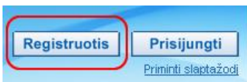
1 pav. Registracijai skirtas mygtukas

Interneto naršyklėje surinkite adresą http://portalas.emokykla.lt ir spauskite viršuje dešinėje pusėje esantį mygtuką „Registruotis“.